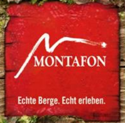
Gewinner des Montafoner Frühlings Facebook-Fotowettbewerbs.